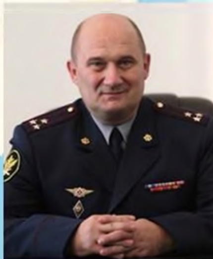
Начальник УФСИН России по Республике Тыва полковник внутренней службы

Располагая свободными производственными площадями, колонии республики имеют возможность для размещения и организации малых производств со сторонними предприятиями.